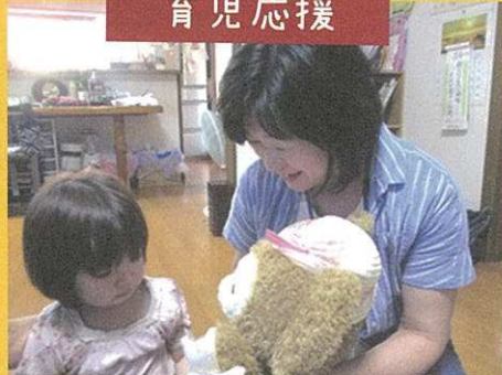
「うさぎちゃんといっしょにお留守番しようね」 託児の応援中！