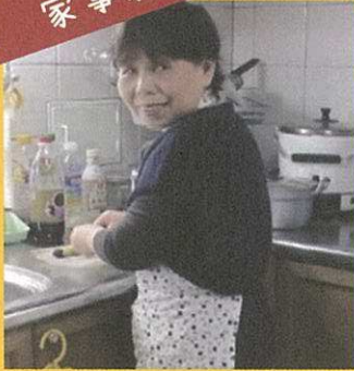
「待ってたよ！」がうれしい 食事作りの応援中！