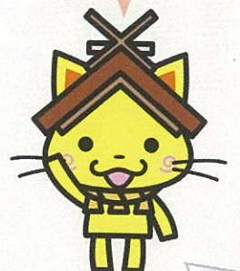
島根県観光キャラクター 「しまねっこ」