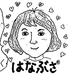
はなぶささんです

転勤や育児でしばらくの間 家庭の中で過ごす日々でしたが、子供達も少しずつ手が離れたのでニュースでコーディネーターの募集を知ってよし!!と応募しました。慣れないことばかりですが、周りの方々にあたたかく見守って頂いて感謝しています。日々勉強です。